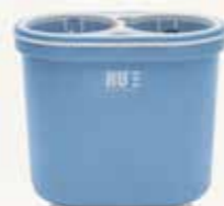
NU® pro Iceblue